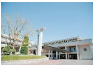
東生駒キャンパス