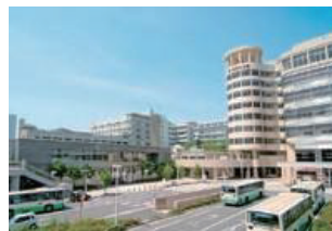
学園前キャンパス